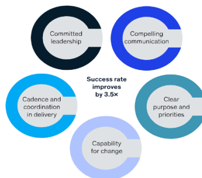
5 key components of government transformation

Ini sebenarnya paradoks di satu sisi, misi layanan publik pemerintah memberi mereka keunggulan berbeda dibandingkan sektor swasta dalam hal memobilisasi orang untuk menghayati nilai-nilai